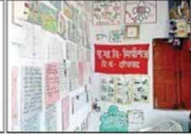
स्कूल की दीवारों पर टीएलएन की पेंटिंग और